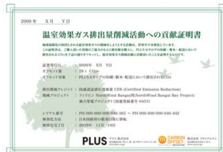
「温室効果ガス排出量削減活動への貢献証明書」

カatalogをご購入いただいた販売店には、「温室効果ガス排出量削減活動への貢献証明書」を発行。貢献証明書の発行は、メーカーの製品を紹介する年間カatalogとしては、文具・オフィス家具業界初の試み ※2 です。カatalogのお届けと同時に、企業として、地球温暖化防止をサポートしてまいります。