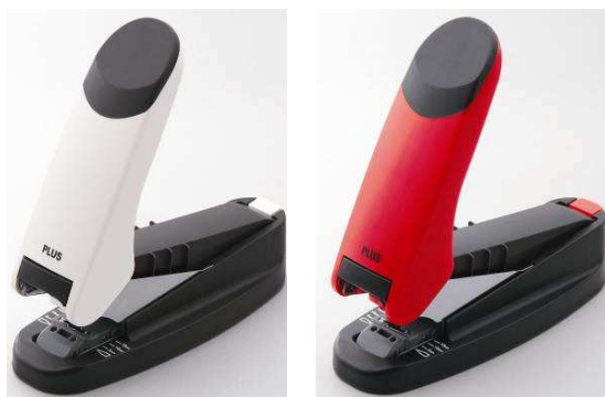
「フラットかるヒット 60」