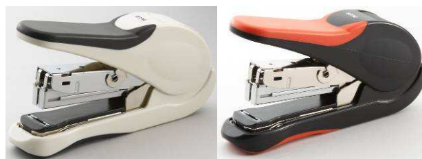
「フラットかるヒット 30」