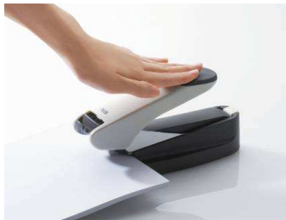
「フラットかるヒット 60」